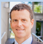
George Benchetrit Chaitons LLP Toronto