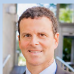
George Benchetrit Chaitons LLP Toronto