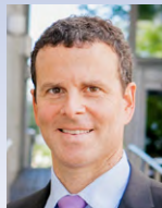
George Benchetrit Chaitons LLP Toronto