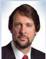
David Mann Dentons Canada LLP Calgary