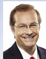
David Bish Torys LLP Toronto